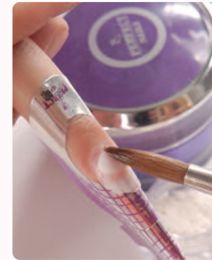
2. Dupla sablonos technikát alkalmazok, Perfect Clear porcelánhoz gyöngyház pigment port keverek az alapréteghez.