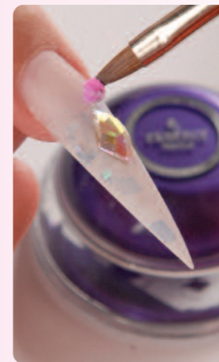
7. Perfect Pink színes porcelánból leveleket készítek szorosán a kő mellé. Ehhez is a „No Primer Liquid”-et használom.