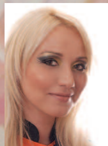
a körmöt készítette: SIROKAI MARCSI Perfect Nails szakoktató – London, Nemzetközi NSI tréner, díszítő mester, Nail master okleveles mester