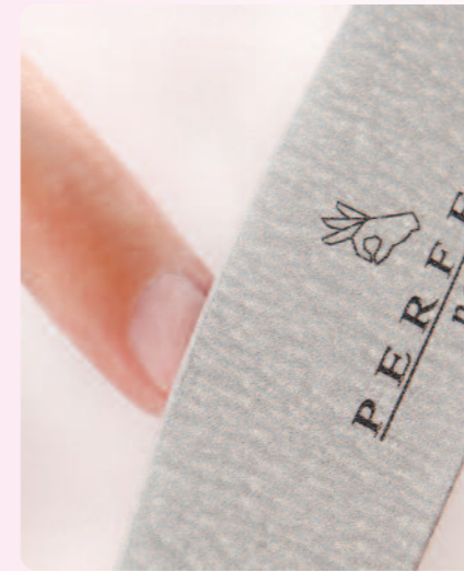
1. A természetes köröm előkészítése után „No Primer Liquid”-del dolgozom, így nem kell primert használni.