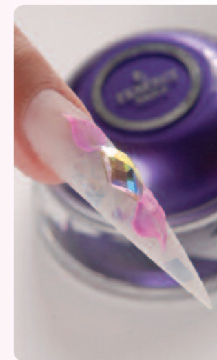
8. A szirmokat is elkészítem.