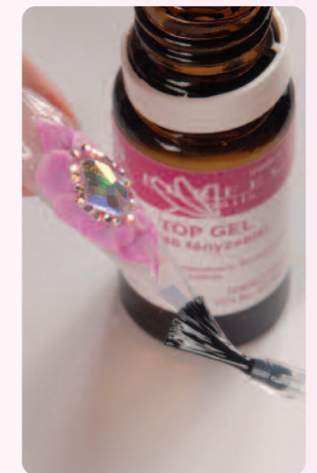
10. Perfect Top Gel segítségével megadom a végleges fényt.