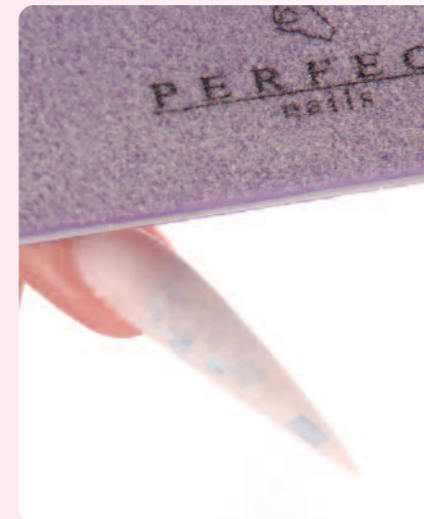
4. Megmunkálom a végleges stiletto formát, majd a speciális Perfect-es lila reszelő-buffer segítségével eltüntettem a reszelő nyomokat.