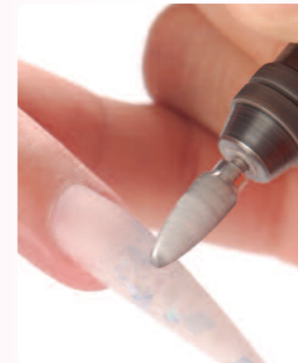
5. A köröm felületébe fúrok egy mélyedést, ez biztosítja a kő síkbeli tökéletes illeszkedését.